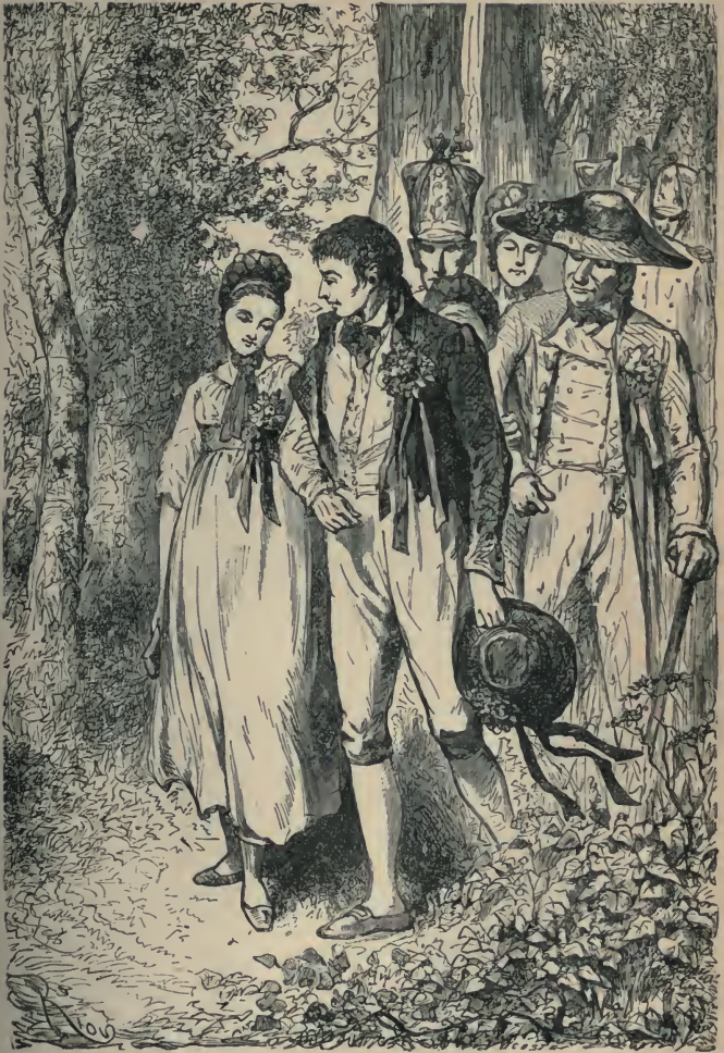
DEUX JOURS APRÈS EUT LIEU MON MARIAGE. (PAGE 86.)